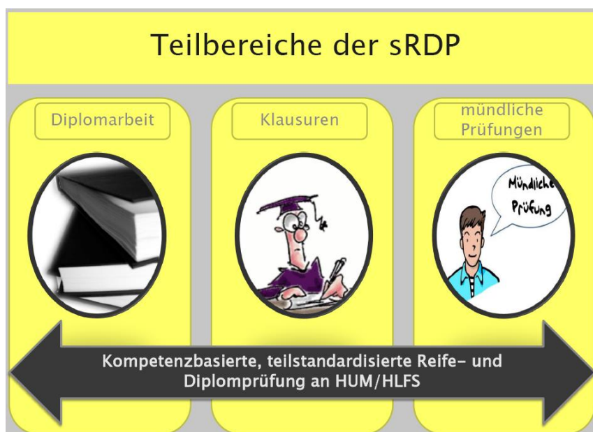
Abbildung 1: Teilbereiche RDP (HUM, kein Datum)

Deine Reife- und Diplomprüfung besteht – neben der Vorprüfung - aus drei verschiedenen Teilbereichen: